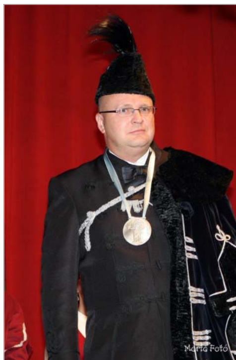
A legújabbkori kiskunkapitányok névsora: